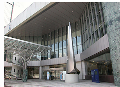
音楽堂入口 (JR金沢駅前)