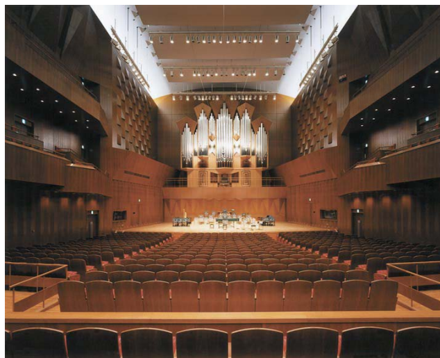
コンサートホール