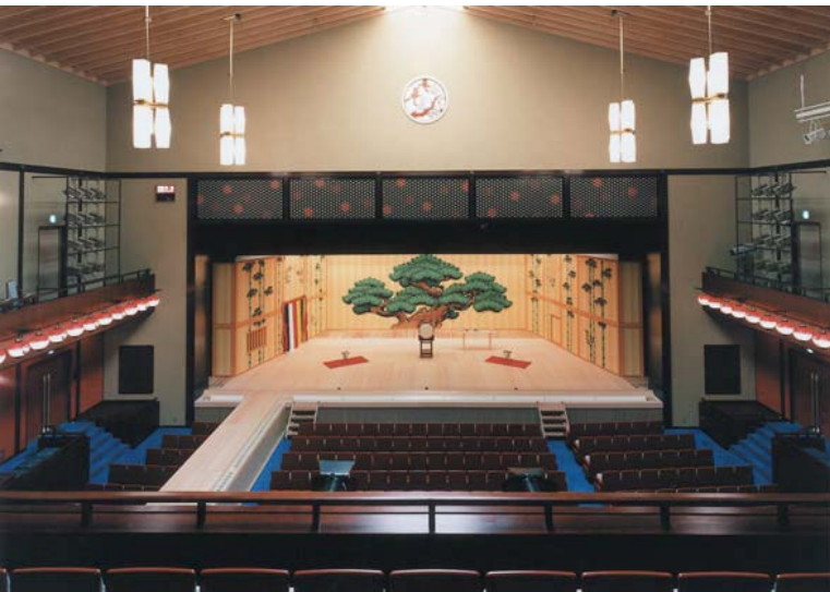
邦楽ホール (口頭発表会場)