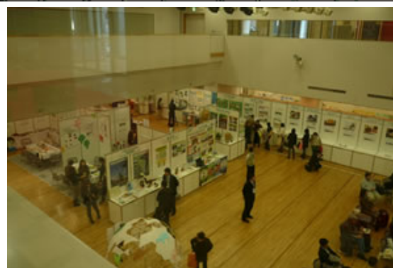
交流ホール (ポスター・附設展示会場)