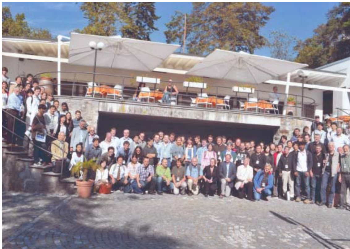
写真：15th ICRP 会場にて記念撮影

最後になりますが、本学会への参加をご支援頂きました日本核磁気共鳴学会関係者の皆様に深く感謝致します。